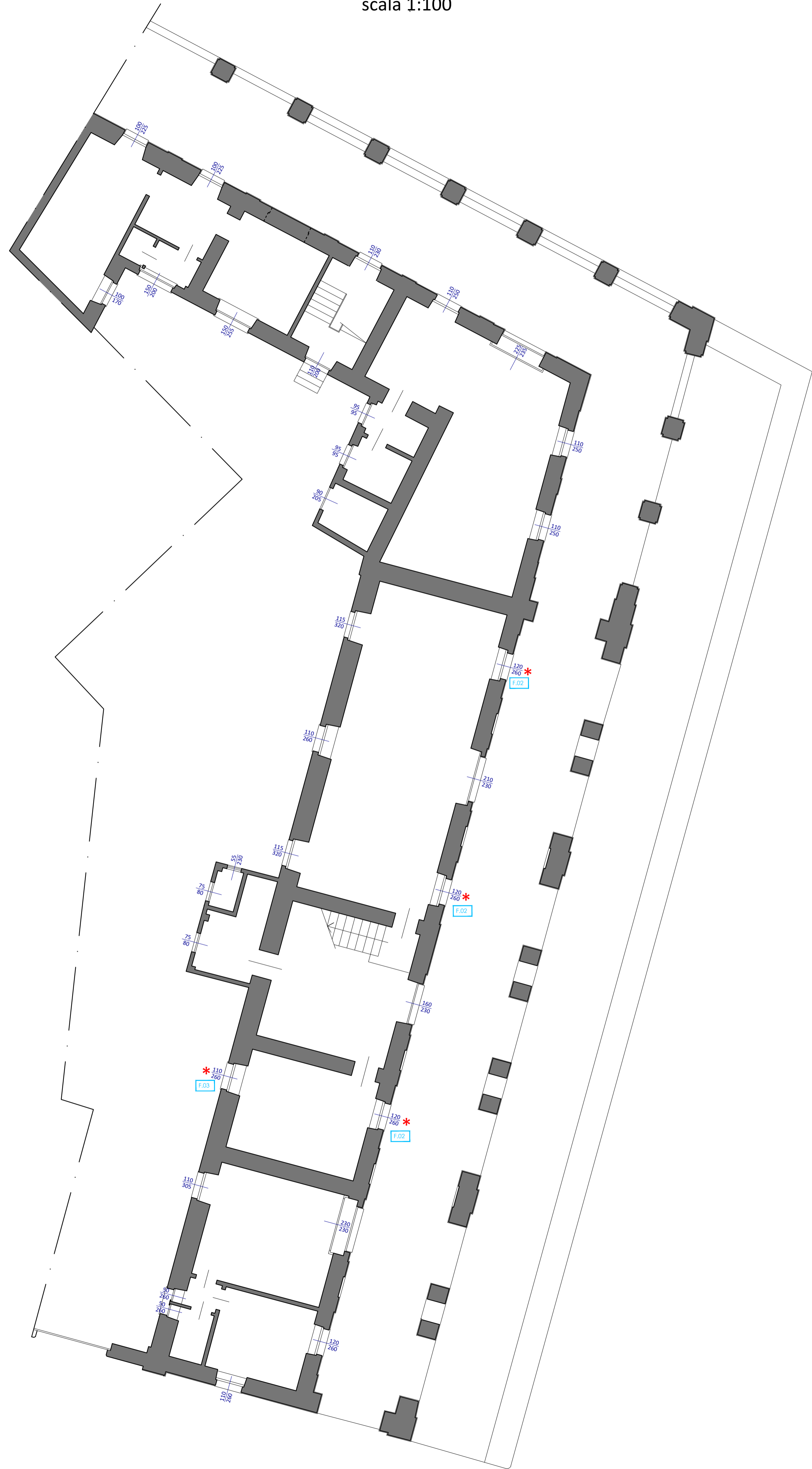
PIANTA PIANO TERRA scala 1:100